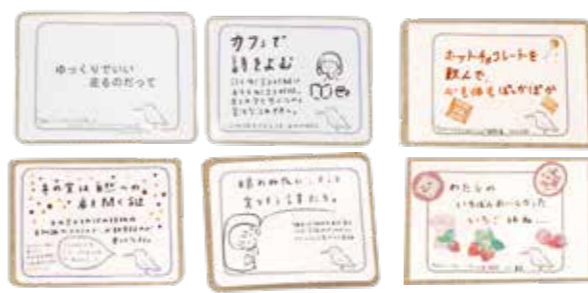
▲図書へのキモチがぎゅっと詰まったPOPは、カフェ文庫でも。

カフェタイムに 寄り添う20冊 とあるカフェの店内。本棚には、愛らしい案内サインとともにお店の雰囲気にしっくり馴染む書籍が並んでいます。実はこの本たち、すべて中央図書館の貸し出し本。担当司書が、カフェの好み・季節性などを考慮しながら20冊を選書したもので、『カフェ文庫』と名づけられています。 移動図書館や団体貸し出し(事業所や子ども園、児童クラブなどの施設)といった館外貸し出しの二つの形として、近年「図書館を届ける(アウトリーチ)」活動が広がっています。多くは高齢などにより来館が難しい人たちのために行われてきたサービスですが、『カフェ文庫』では、比較的読書から離れがちな20~30代の利用も見込まれます。『本は、カフェで過ごす時間と相性がいいのでは?』というアイデアから昨年度にスタートした新しいサービスです。