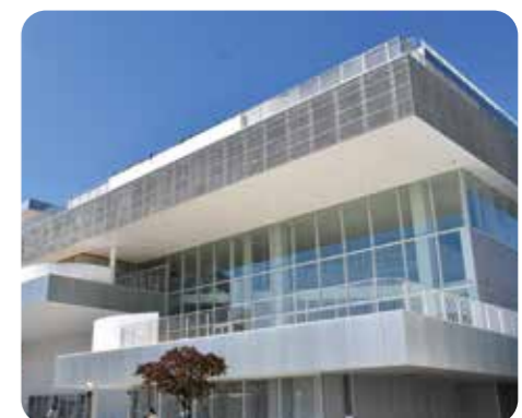
tette 中央図書館の風景

いつでも誰にでも開かれた新しい世界への入り口 『図書館』が、街なかのカフェに飛び出した!