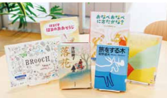
小針さん・吉田さんが福島ゆかりの作家などおすすめ5冊を選書。美しい装丁と豊かなまなざしでつづられた文体、印象的な絵が心を軽くしてくれます。