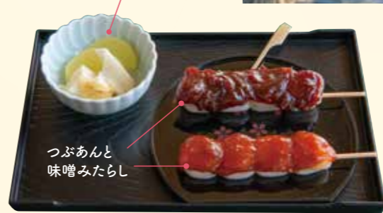
つぶあん味 味噌みたらし