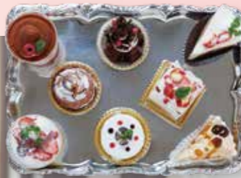
お好みでセレクトできるケーキ(単品)570円※ケーキのみご注文の場合620円