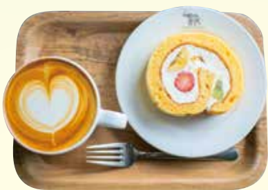
カフェラテ 650円 米粉ロールケーキ 550円