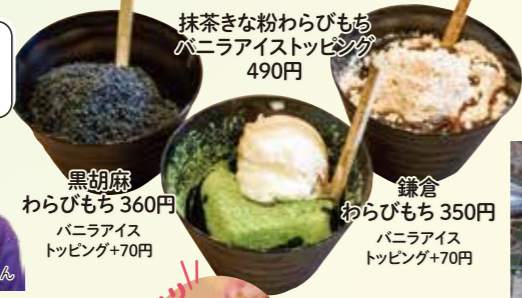
抹茶きな粉わらびもち バナナアイストッピング 490円

おすすめは気軽にわらびもちを楽しめるこちらのメニューです。弾力のあるわらびもちが2個入りで、バナナアイスのトッピングも可能です。