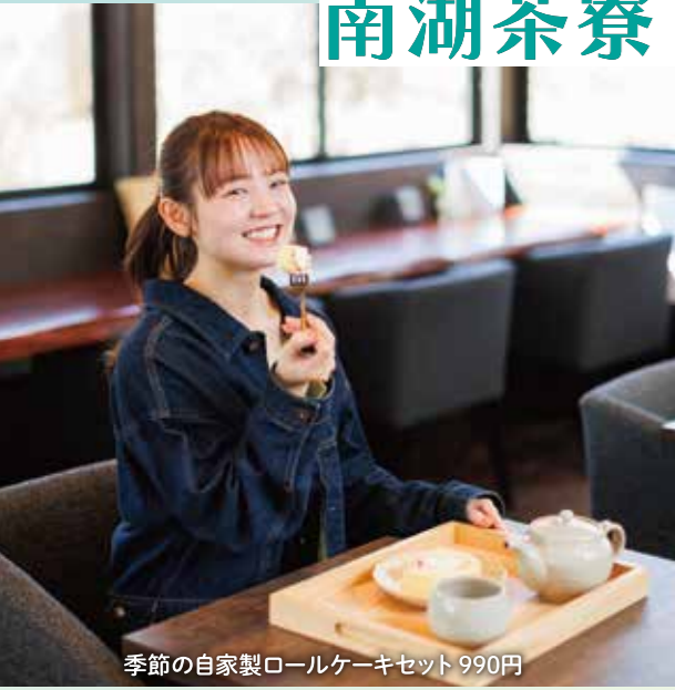
季節の自家製ロールケーキセット 990円