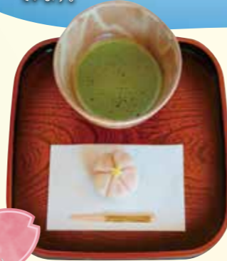
翠楽苑 桜まつり 4/5(土) 6(日)

池泉回遊式の日本庭園を散歩した後は、眺めのいい和室でのんびりと、庭園と季節を感じる上生菓子・抹茶を楽しめます。