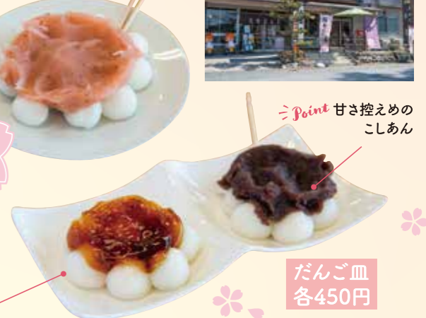
Point 甘さ控えめのしあん