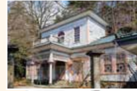
ファンマルシェ 4/13(日)