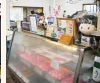
▲ショーケースに並ぶ新鮮なお肉