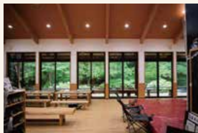
▲隈戸川の溪谷が美しいハワイエ

白河市大信隈戸国有林57 TEL.0248-46-2471 営 9:00~17:00 休 火・水