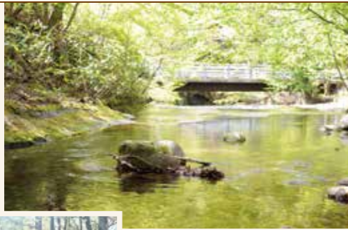
▲隈戸川(キャンプ場内)