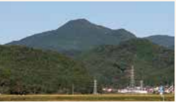
◀市内最高峰の 権太倉山 (標高976m) うつくしま 百名山