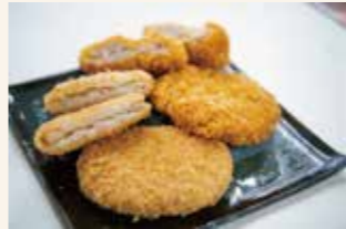
▲注文後に揚げてくれるお惣菜もあります!種類豊富で迷います。