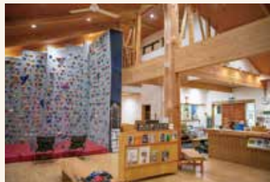
▲ボルダリングが気軽に楽しめます

◆ ビジターセンター:施設利用料 ボルダリング・ロープクライミング/2時間 大人220円、小人110円 レンタルシューズ/2時間 大人220円、小人110円