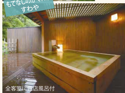
全客室に湯店風呂付

旧四辻分校跡地をリノベーションした森の駅 Yodge。カフェでは、地元産の旬の食材にこだわったランチがいただけます。この日はオリジナルビスケットをオーダー。トッピングは玉川産ナストマト・ヤングコーン。採れたてのおいしさはスパイスの効いたうま味たっぷりのビスケットに負けない存在感です! 東西の標高差が大きく、福島県産の野菜のほとんどを村内で生産できる玉川村。一年を通して品質のいい野菜や果物がたくさん生産されています。せっかく森の駅 Yodge を訪れたなら、ぜひアクティビティ体験を、サウナ好きの私がハマっているのは、広い校庭でじっくり汗を流したら、森の香りを感じながら外気浴へ。心も体もすっきり整って最高です! 森の駅 Yodge 近くの丘の上では、今年からエミューの飼育がはじまりました。いまのところ観光目的ではありませんが、オーナーのご厚意で見学も可能。立ち寄ってみてはいかがでしょうか。