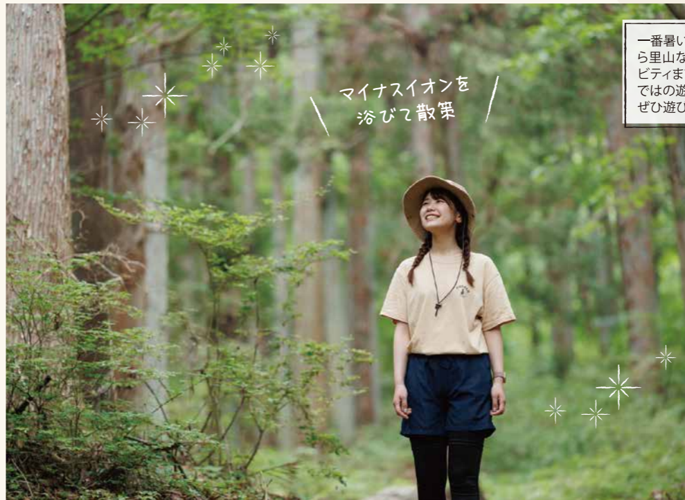
マイナスイオンを 浴びて散策