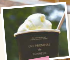
yodgeジェラート フレーバーは 5種類