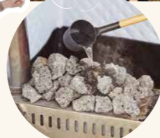
開放感たっぷりのロケーションで心とカラダを整えて!