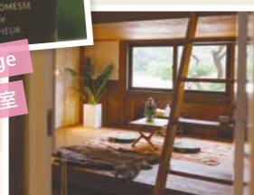
メゾネット式で 基地のよう