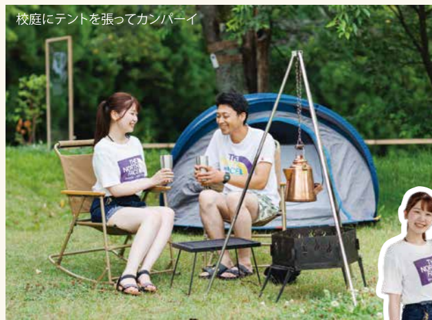
校庭にテントを張ってカンパニー