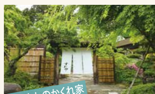
もてなしのくれ家 すわや