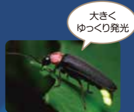
ゲンジボタル 大きさは10~20mm。黒い十字の模様が特徴。幼虫は、澄んだ流水を好み、山間の川に多く生息。