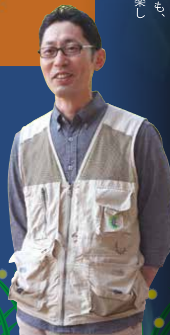
◀ムシテックワールド ふくしま森の科学体験センター 塩澤に行さん