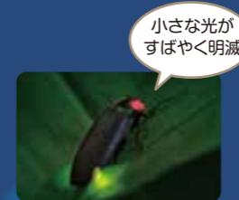
ヘイケボタル 大きさは7~10mm。太くて黒い筋が特徴。幼虫は、水田や用水路などに生息。