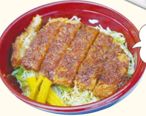
24 熱々サクサクなソースカツをご家庭で! 召し上がれ! ソースカツ丼 650円(税込)