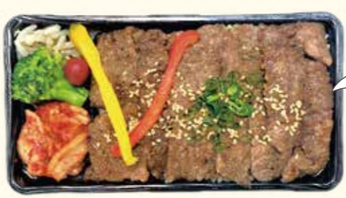
23 黒毛和牛カルビのお弁当がこのプライス?! 当日のご注文OK! 何個からでも承ります! 黒毛和牛カルビ重 800円(税込)