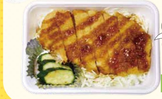
29 植物性油使用で脂っこくない! どんどん食べれるボリューム満点ソースカツ丼♪ ソースカツ丼 850円(税込)