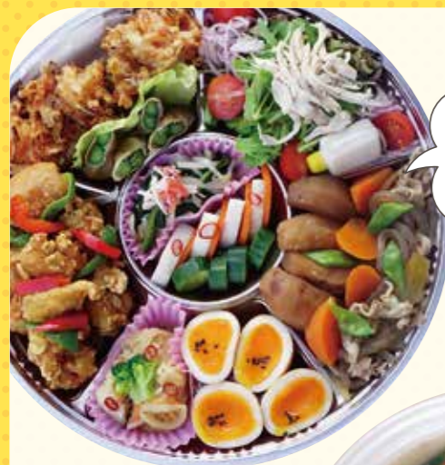
17 旬の食材で作る自慢のオードブルはお酒にもおかずにも◎予算に合わせてお作りします! 旭屋オードブル 3,000円(税込)