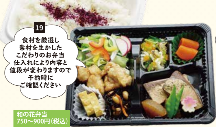
19 食材を厳選し素材を生かしたこだわりのお弁当仕入れにより内容と値段が変わりますので予約時にご確認ください 和の花弁当 750~900円(税込)