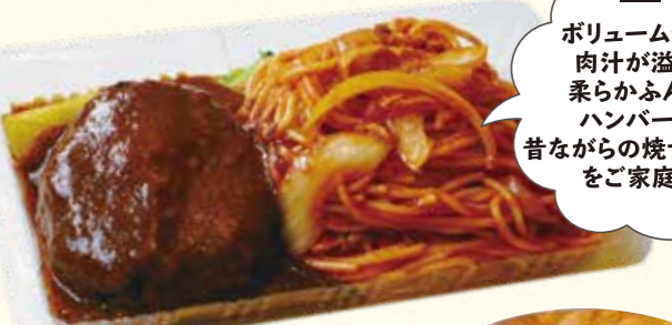
ハンバーグスパゲッティ 1,188円(税込)