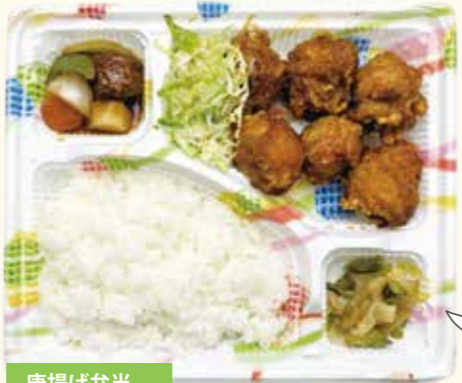
唐揚げ弁当 660円(税込)