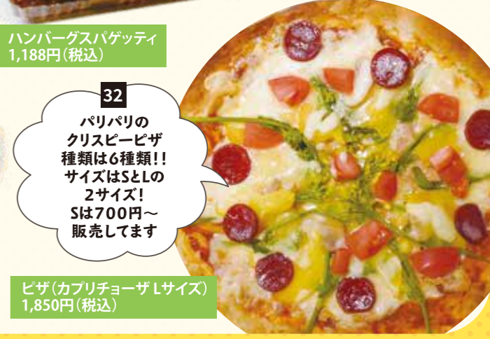
32 パリパリのクリスピーピザ種類は6種類!! サイズはSとLの2サイズ! Sは700円~販売してます ピザ(カブリチョーザLサイズ) 1,850円(税込)