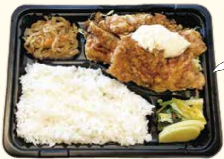
30 タルタルソースたっぷりのチキン南蛮は食べ応えアリ! 味、ボリュームともに大満足! チキン南蛮弁当 864円(税込)