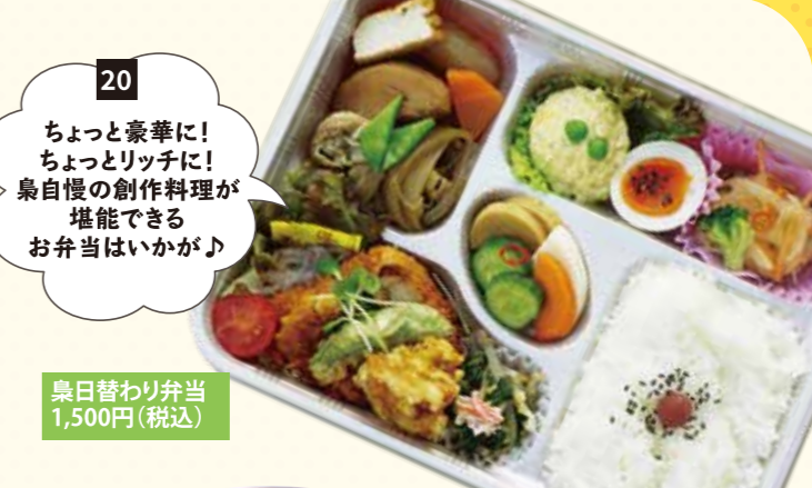
20 ちょっと豪華に! ちょっとリッチに! 鼻自慢の創作料理が堪能できるお弁当はいかが! 鼻日替わり弁当 1,500円(税込)