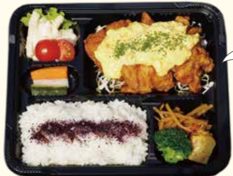
18 人気のサンドイッチ他お弁当オードブルもテイクアウト可! チキン南蛮弁当 580円(税込)