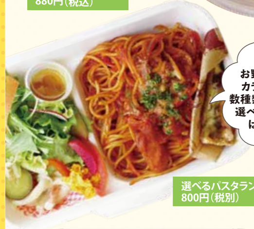
25 お野菜たっぷりカラダに優しい数種類の Pasta から選べるカフェ弁当はいかが!? 選べるパスタランチ弁当 800円(税別)