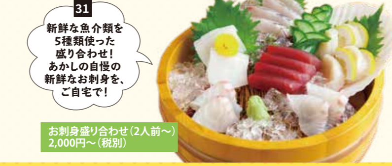
31 新鮮な魚介類を5種類使った盛り合わせ! あかしの自慢の新鮮なお刺身を、ご自宅で! お刺身盛り合わせ(2人前~) 2,000円~(税別)