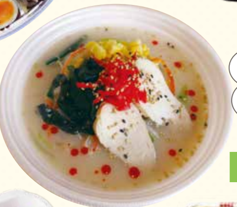
21 練りごまベースのタレに和風だしの冷たいスープ、たっぷりのセサミンで免疫力アップ!! 冷やしごまラーメン 880円(税込)