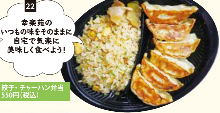
22 幸楽苑のいつもの味をそのままに自宅で気楽に美味しく食べよう! 餃子・チャーハン弁当 550円(税込)