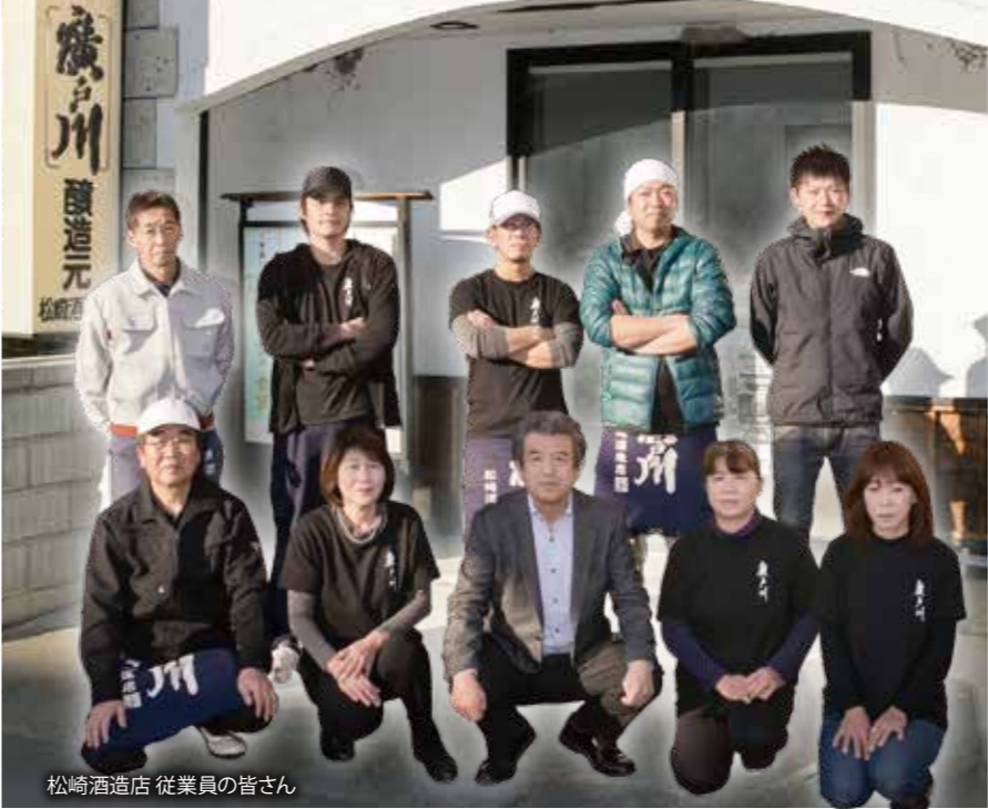
松崎酒造店 従業員の皆さん