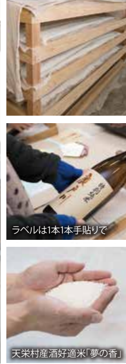
ラベルは1本1本手貼り